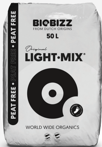
SACS 20L, 50L