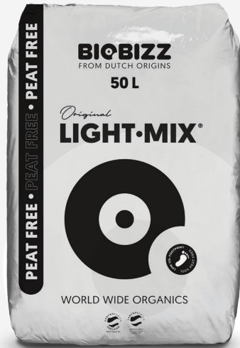
PACKUNGSGRÖSSE 20L, 50L