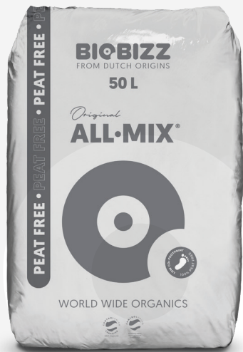
BORSE 20L, 50L