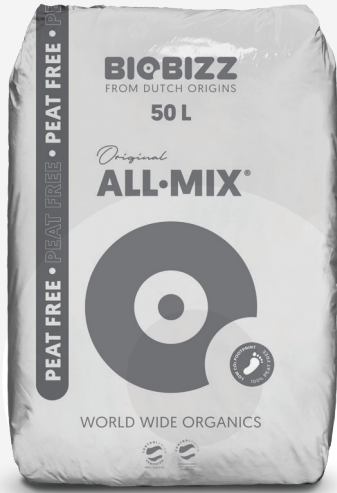
SACOS 20L, 50L