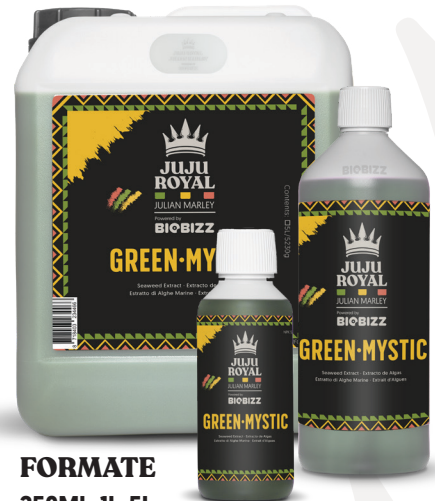
FORMATE 250ML, 1L, 5L

Green-Mystic ist arm an Stickstoff, Phosphor und Kalium, was es zu einer sehr vielseitigen Stimulanz macht, die sowohl in der Wachstums- als auch in der Blütephase eingesetzt werden kann. Sie können es mit jedem Nährboden von Juju Royal Julian Marley Powered by Biobizz ausprobieren