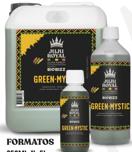
FORMATOS 250ML, 1L, 5L

Green-Mystic es un estimulante con bajo contenido en nitrógeno, fósforo y potasio, de modo que podemos utilizarlo tanto en crecimiento como en floración. Prueba a usarlo en cualquier medio de cultivo Juju Royal Julian Marley Powered by Biobizz.